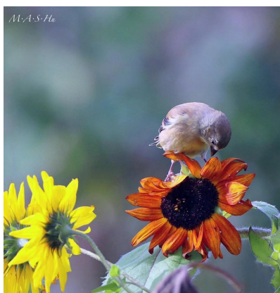
A goldfinch kissing the autumn flowers