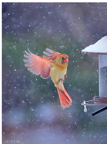
cardinal in the snow