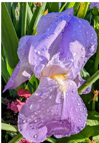
Vincennes森林中雨后绽放的花朵