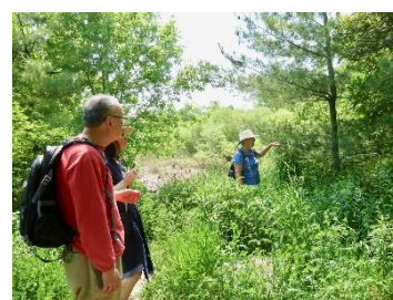
听一位熟悉植被的姊妹讲解