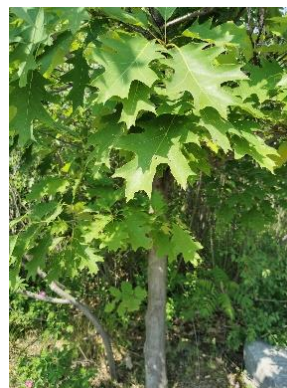
针橡树 Pin Oak