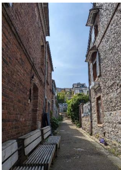
两百年前女演员奥贝尔居住地