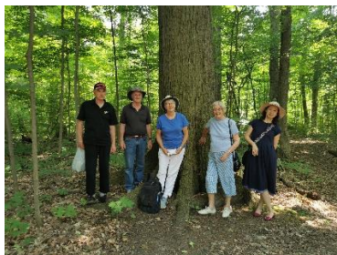
每次自然散步都会打卡的地方