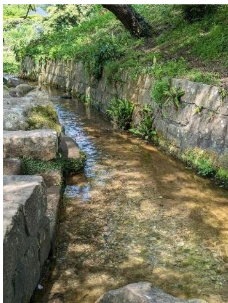
法国最短的沃勒河发源地