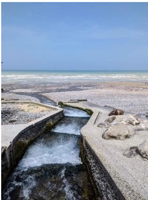
沃勒河注入大西洋芒什海峡