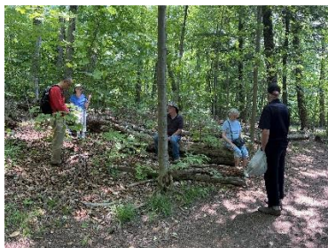
全然安静听各种鸟鸣