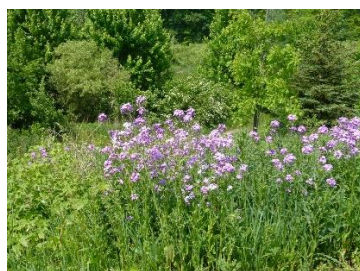
遍地的天蓝绣球花 Phlox